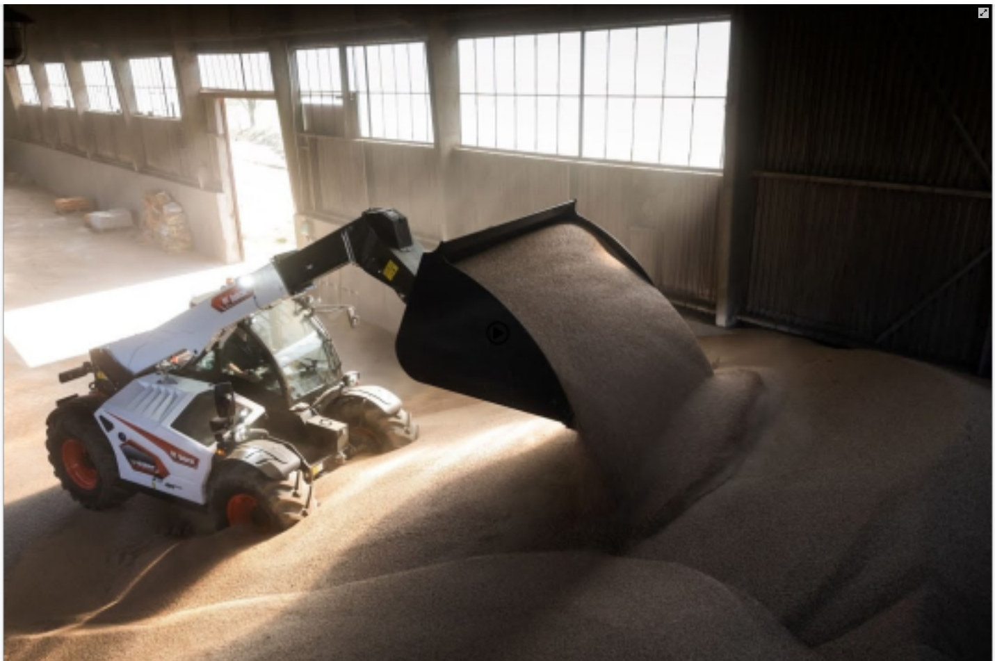
Présentation de la nouvelle série R de téléscopiques pour l'agriculture